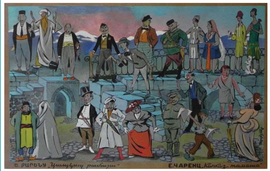
«Կասկած» թամաշա Սերգեյ Աբուտչյան, կերպարների էսքիզ