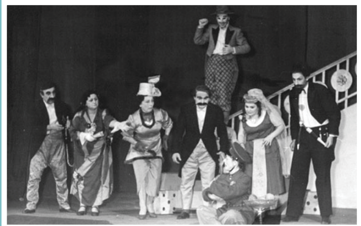
Դրվագ «Կասկած» թամաշայից Հ. Պարոնյանի անվան կոմերիայի պետական թատրոն Բեմ.՝ Տ. Վարդապարյանի